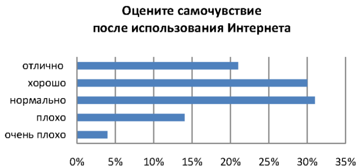
Рис. 3. Оценка физического самочувствия респондентов после использования Интернета (%)

много времени, 40 % замечают лишь при напоминании другими. Несмотря на замечания других людей, не все респонденты признают факт слишком долгого нахождения в сети.